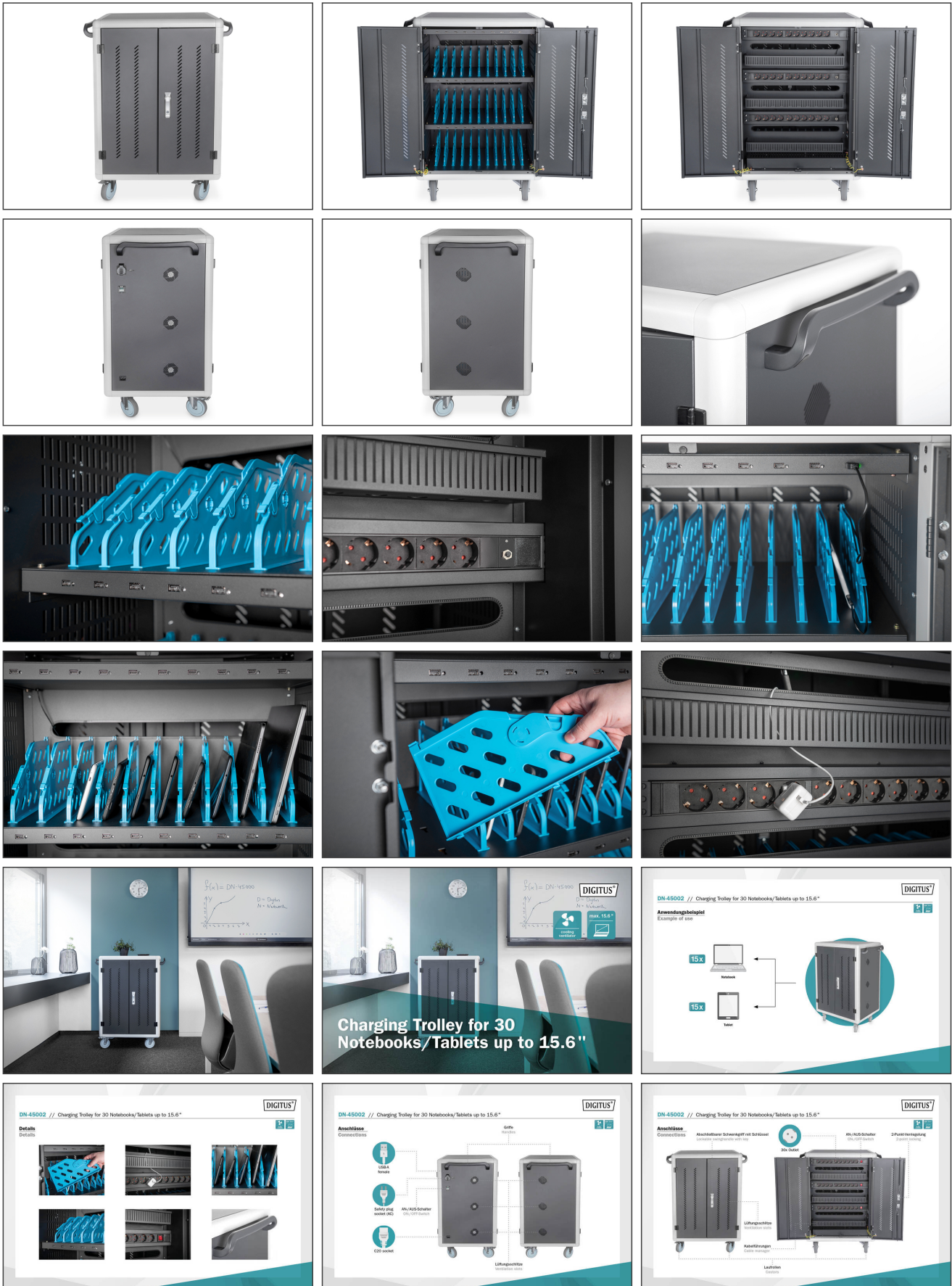
Charging Trolley for 30 Notebooks/ Tablets up to 15.6"