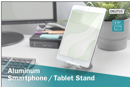
Aluminum Smartphone / Tablet Stand