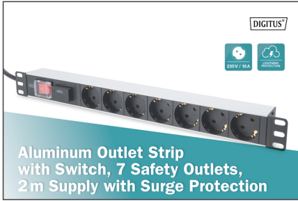
Aluminum Outlet Strip with Switch, 7 Safety Outlets, 2m Supply with Surge Protection