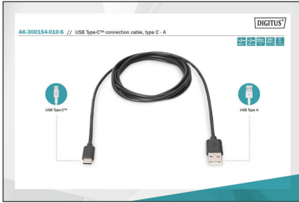
AK-300154-010-S // USB Type-C™ connection cable, type C - A