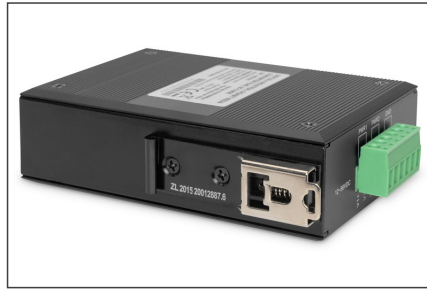
DA-652101 Industrial gigabit Media Converter RJ45, SC 0.5km DIGITUS