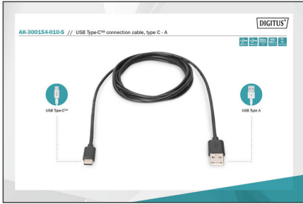
AK-300154-010-S // USB Type-C™ connection cable, type C - A