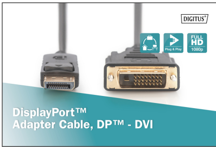
DisplayPort™ Adapter Cable, DP™ - DVI