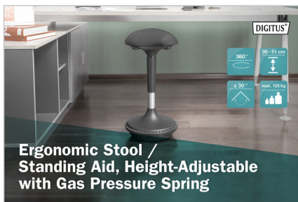
Ergonomic Stool / Standing Aid, Height-Adjustable with Gas Pressure Spring