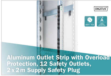
Aluminum Outlet Strip with Overload Protection, 12 Safety Outlets, 2 x 2 m Supply Safety Plug