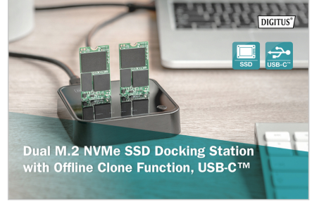
Dual M.2 NVMe SSD Docking Station with Offline Clone Function, USB-C™