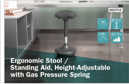
Ergonomic Stool / Standing Aid, Height-Adjustable with Gas Pressure Spring