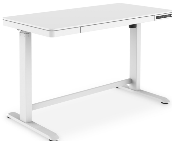
Table électrique à hauteur réglable, plateau 120 x 60 x 12 cm Charge de 50 kg, ports de charge USB, blanc

Avec ce cadre de table réglable en hauteur de DIGITUS®, vous prenez soin de vous et votre santé ! La table peut être réglée en hauteur de 72 à 121 cm via le panneau de commande intégré, tandis que la fonction de protection anti-collision permet d'éviter les chocs avec des obstacles sous le plateau. Le panneau de commande peut être verrouillé pour empêcher les enfants de jouer avec, par exemple. En outre, les appareils mobiles tels que les smartphones ou les tablettes peuvent être chargés via les 3 prises USB existantes, deux prises USB A et un port USB-C™ disponibles. Le tiroir situé sous le plateau sert d'espace de rangement pratique, ce qui vous permet de mettre de l'ordre sur votre bureau en un rien de temps. Prenez soin de votre santé et prévenez les défauts de posture et limitations de l'appareil locomoteur en vous levant régulièrement !