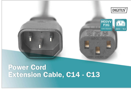
Power Cord Extension Cable, C14 - C13