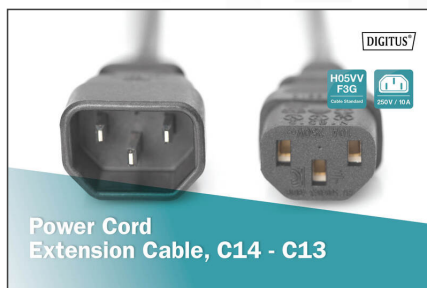
Power Cord Extension Cable, C14 - C13