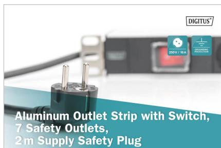
Aluminum Outlet Strip with Switch, 7 Safety Outlets, 2m Supply Safety Plug